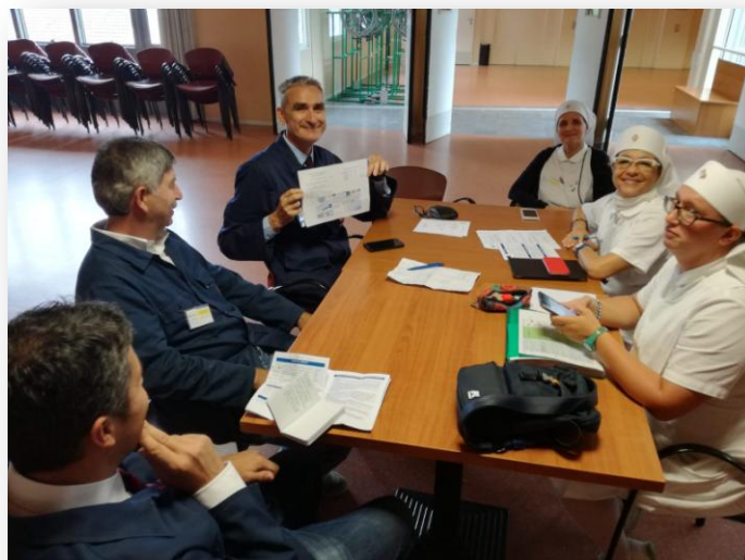
Referenti durante una riunione organizzativa