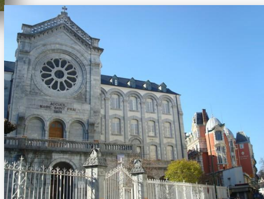
ACCUEIL MARIE SAINT-