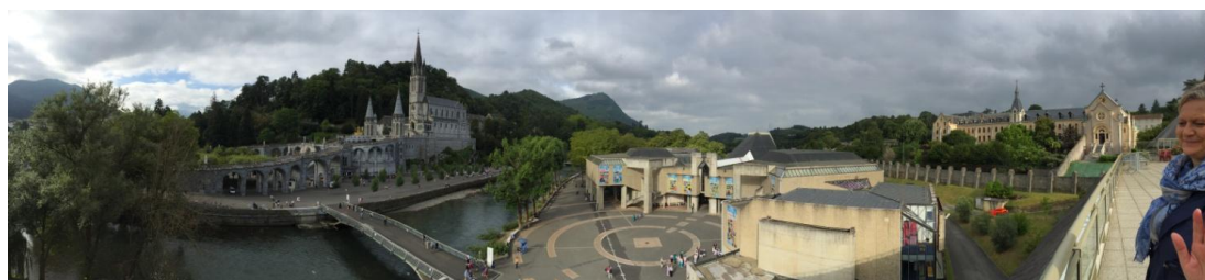
VISTA PANORAMICA DAL SALUS