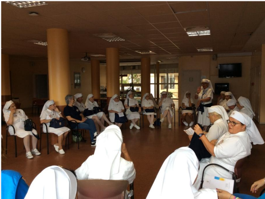
Riunione tra le Sorelle con Presidente Regionale e Responsabili Sorelle

PER LE SORELLE : vengono informate dalle Referenti direttamente ai piani o al refettorio. Anche per loro sono comunque previsti incontri organizzativi e di conoscenza reciproca.