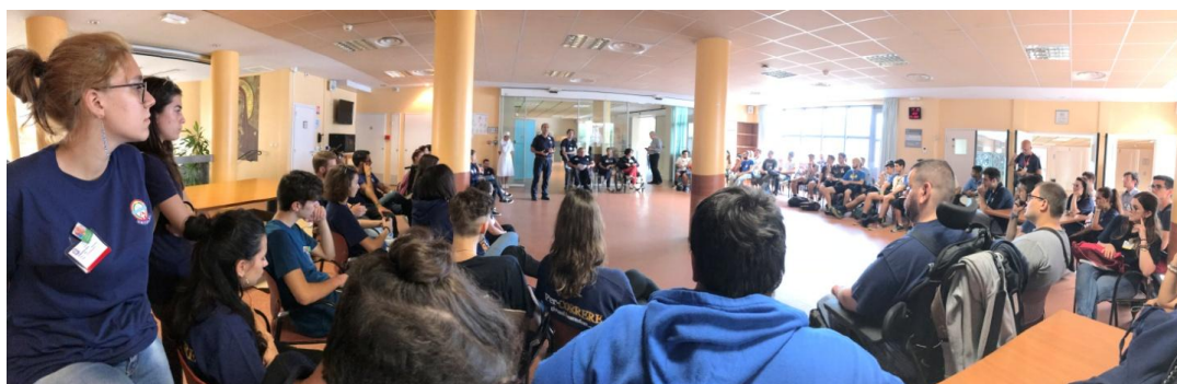
RIUNIONE ORGANIZZATIVA CON I REFERENTI GIOVANI

I nominativi di queste figure sono riportati nel libretto del pellegrinaggio (Direttore, Referenti Barellieri e Sorelle) o nel foglio di servizio individuale.