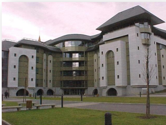
ACCUEIL NOTRE DAME

Tipicamente gli ospiti Unitalsiani occupano solo una parte di tali strutture. All'interno di esse ci sono mappe esplicative della struttura stessa e dell'ubicazione dei vari servizi (mensa, transito, ecc.).